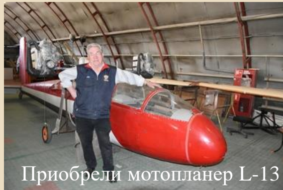
Приобрели мотопланер L-13