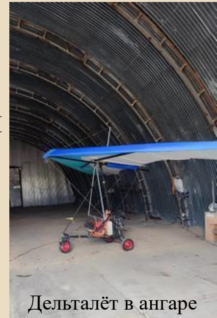
Дельталёт в ангаре

* Подготовка спортивной сборной команды Югры для участия во всероссийских соревнованиях по планерному спорту.