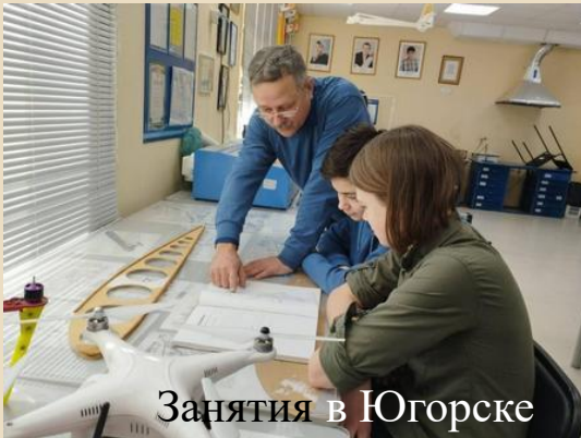
Занятия в Югорске

* Организация теоретической и тренажёрной подготовки курсантов в городах Югры и наземной и лётной подготовки – в г. Урае на ВПП «Авицентра»