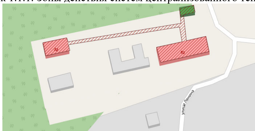
Рисунок 1.1.2. Зоны действия систем централизованного теплоснабжения